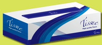
ボックスティッシュ 1箱